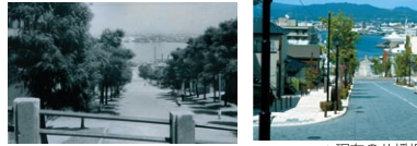
景観や手前の柵などから、八幡坂であろうと推測されます。

函館の代表的な坂の一つである「八幡坂」は、港を一望できるロケーションの素晴らしさからドラマや映画、CMなどの舞台としても頻りに登場する坂で、数多くの観光客が訪れて賑わいを見せています。遠く対岸には、昭和63年(1988)まで青函航路で活躍した摩周丸の姿が見えます。坂の途中に函館八幡宮があったことからこの名が付けられました。八幡宮は明治時代に焼失し、現在は谷地頭町に移転しています。八幡坂の上には函館西高校があり、ここは演歌界の巨匠・北島三郎の母校としても知られています。