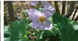
シラネアオイ(5月中旬)