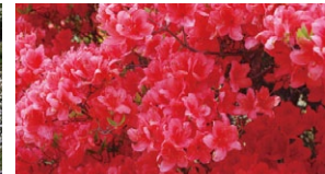
エゾヤマツツジ(5月中旬から6月上旬)