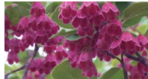
サラサドウダン(6月上旬)